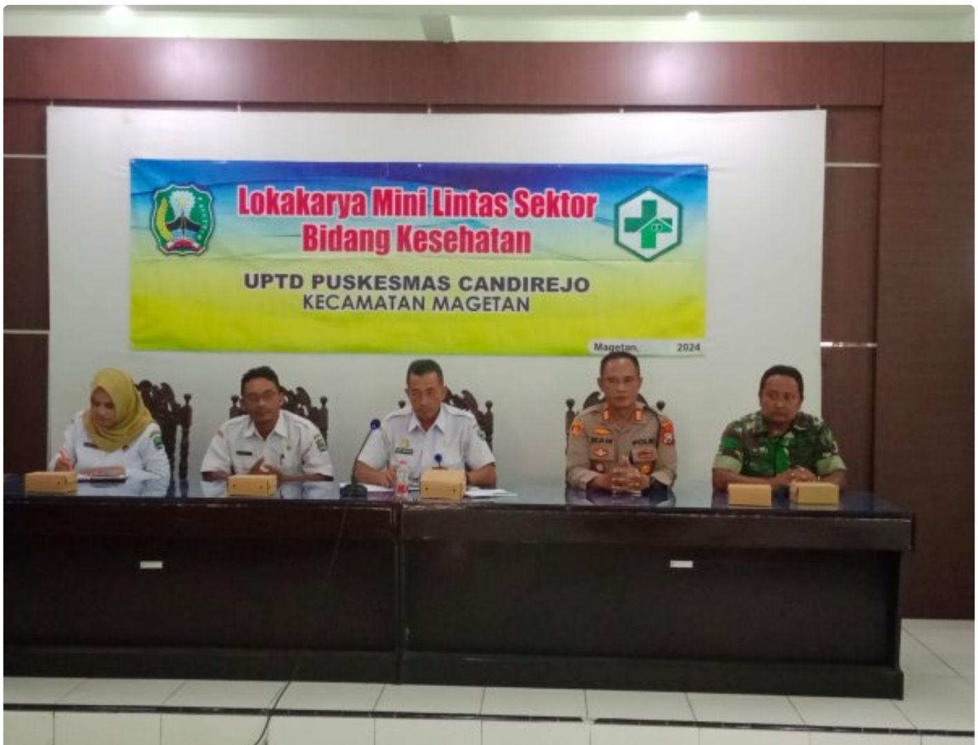
Bati TUUD Koramil 0804/01 Magetan Hadiri Loka Karya Mini Lintas Sektor Tri Bulanan Bidang Kesehatan