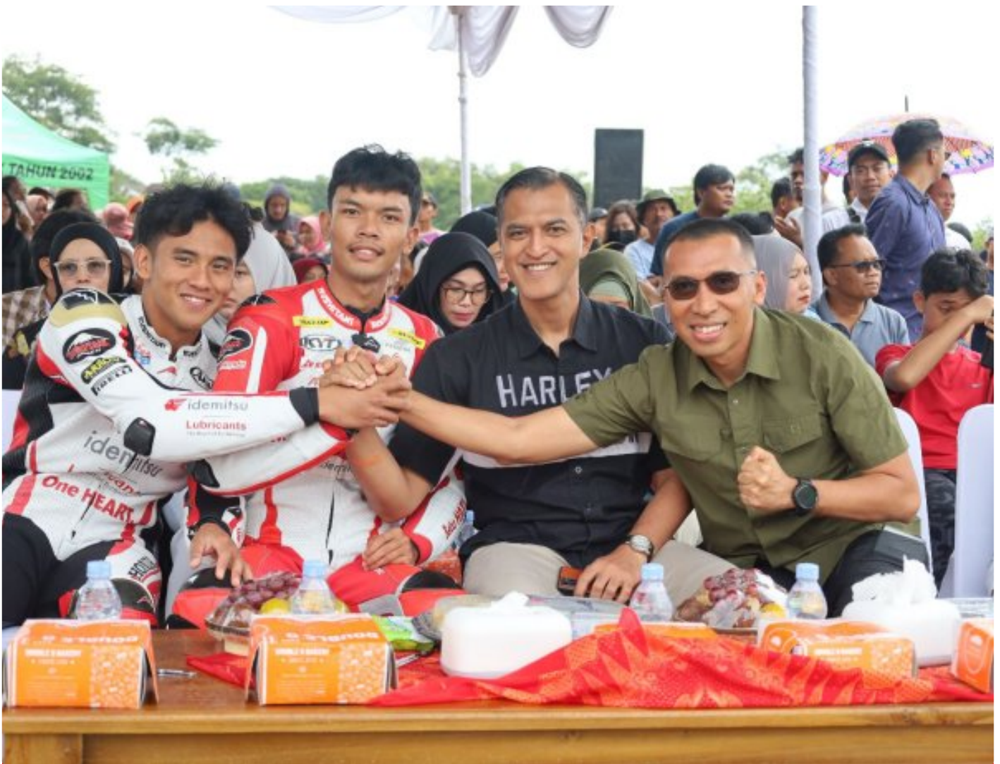
Dandim 0804/Magetan Hadiri Undangan Tinjau Sirkuit Magetan