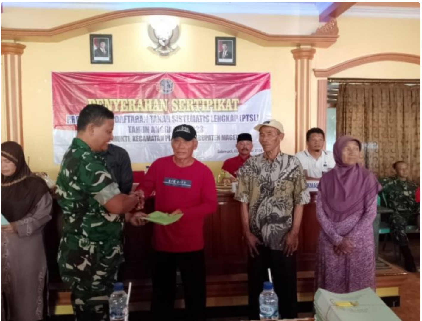
Danramil 0804/02 Plaosan Hadiri Penyerahan Sertifikat Program Pendaftaran Tanah Sistematis Lengkap (PTSL) Desa Sidomukti

PLAOSAN. - Desa Sidomukti melalui Badan Pertanahan Nasional (BPN) melakukan penyerahan Sertifikat Tanah Program Pendaftaran Tanah Sistematis