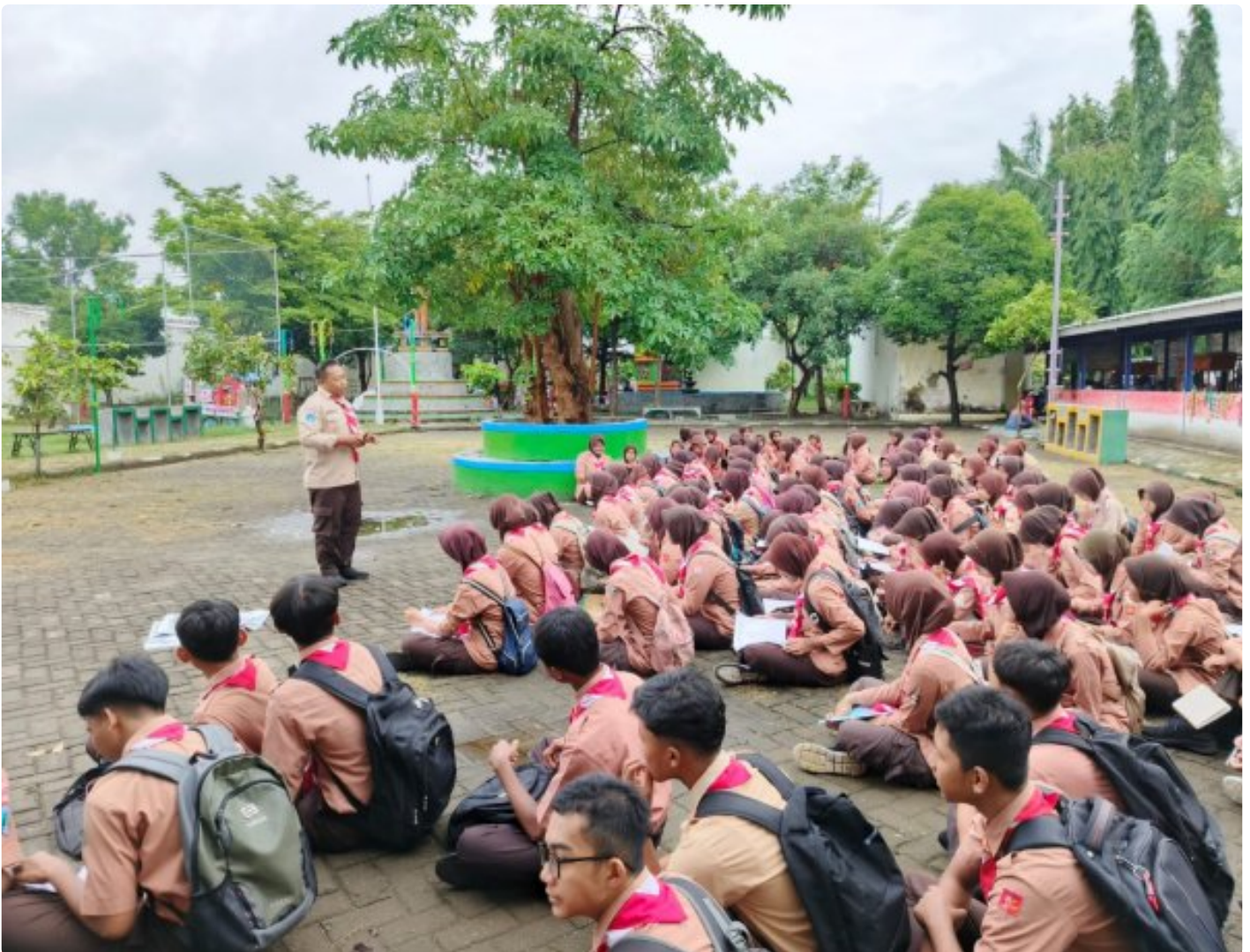
Pembinaan Pramuka Saka Wira Kartika Materi Krida Navigasi Darat Untuk Pengembangan Keterampilan

Magetan. - Dalam rangka memperkuat kemampuan dan keterampilan anggota Pramuka Saka Wira Kartika melaksanakan pembinaan dan pelatihan Krida Navigasi Darat (Navrad). Acara ini diikuti oleh 125 orang anggota pramuka dari