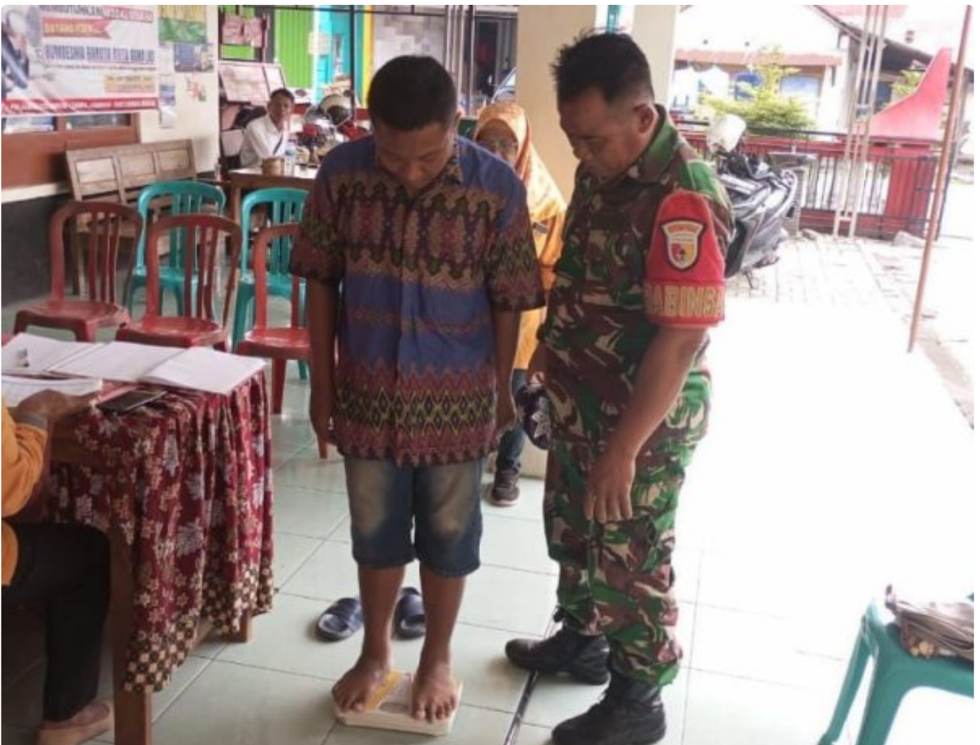
Pentingnya Menjaga Kesehatan, Babinsa Koramil 0804/08 Barat Dampingi Posyandu Jiwa di Desa Binaan